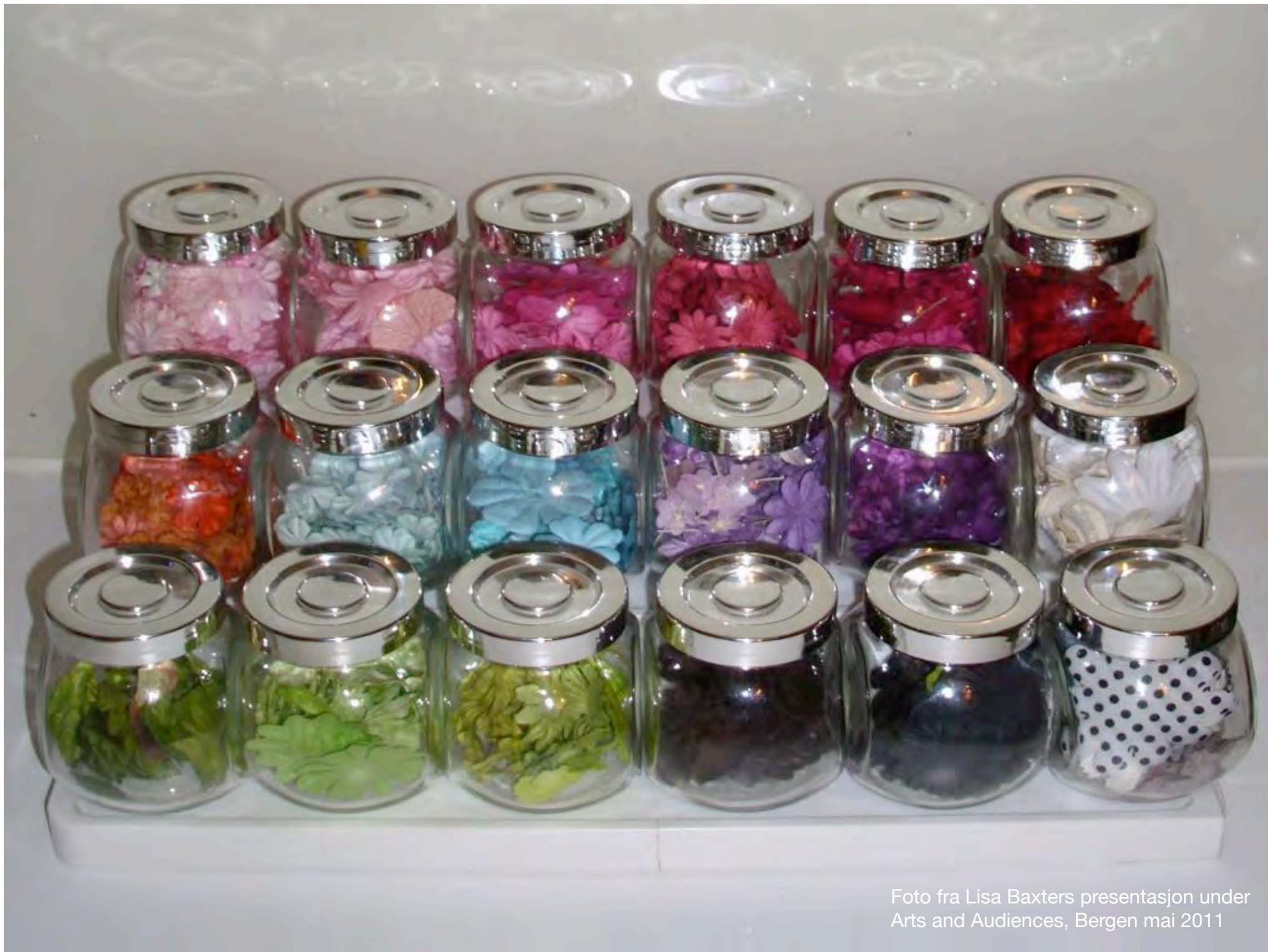
Foto fra Lisa Baxters presentasjon under Arts and Audiences, Bergen mai 2011