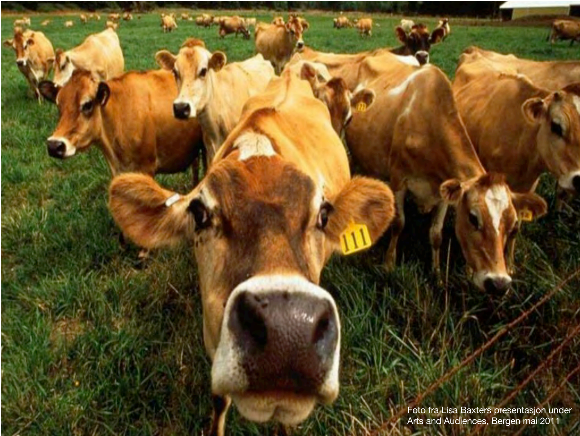
Foto fra Lisa Baxters presentasjon under Arts and Audiences, Bergen mai 2011